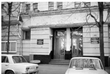
Дом пропаганды советской музыки, 1968 г.