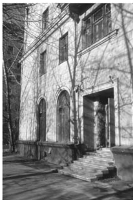
Ул. Трифонова, 33, 1977–1981 г.