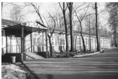
Красный уголок ЦПКИО «Измайлово», 1976