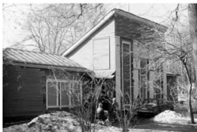
Школа танцев. ЦПКО «Сокольники», 1967–1968 г.