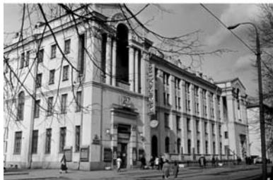
ДК МЭИ, 1959–1963 г.