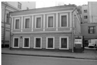
Ул. Герцена, 47, 1985–1986 г.