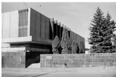
ДК «Москворечье», 1973–1976 г.