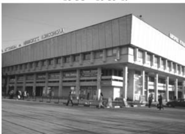
ДК АЗЛК, 2003–2005