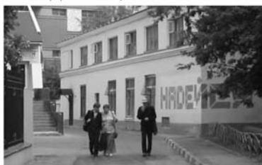
МДСТ, Б.Овчинниковский пер, д.24, стр.5, 2005–...