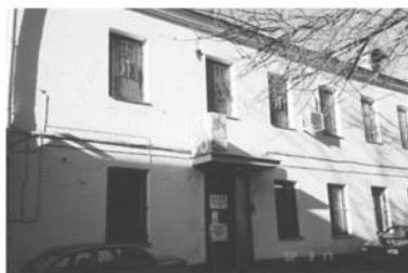
Ул. Осипенко, 73, 1991–2003 г.