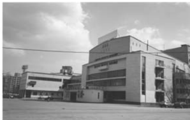
ДК им. С.П. Горбунова, 1977–1985 г.