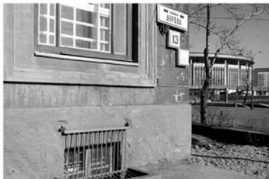
Ул. Дурова, 13. Красный уголок ЖЭКа, 1966 г.